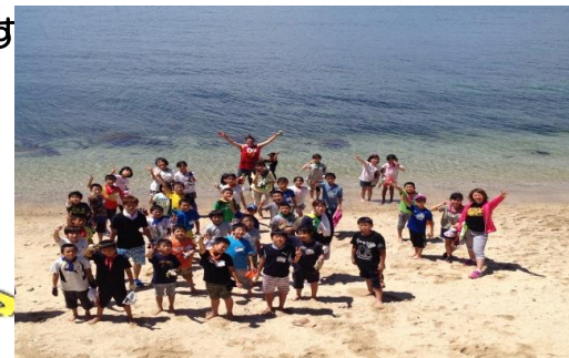
野忽那の海岸にて！