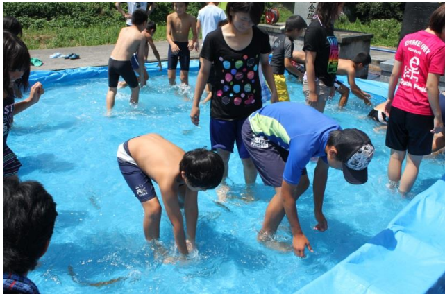
キャンプ時の魚つかみ取り風景！！

立岩地区の美しい棚田の中で、年間を通して野菜や米作りなどの農業体験をおこないます。 また、「食育」をテーマに味噌作り、芋たき作り、餅つき、カレーや味噌販売体験などの活動を予定しています。